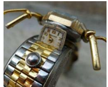
Mini moto fatte con pezzi di orologio...